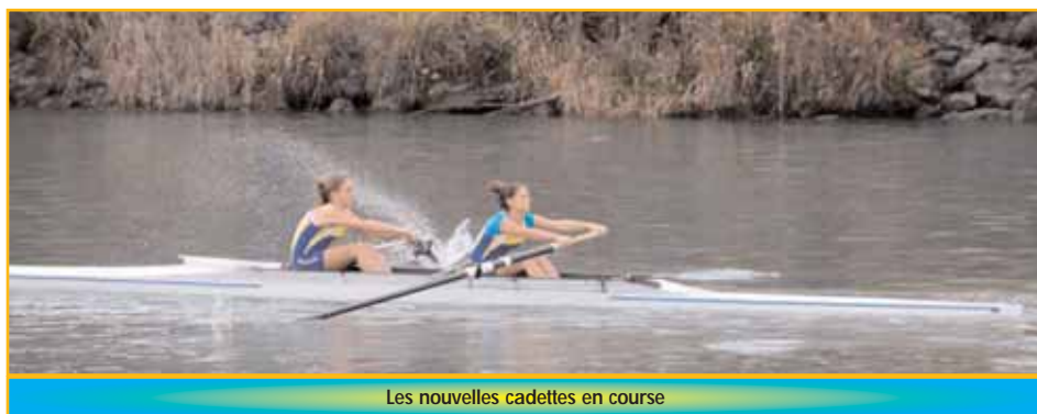
Les nouvelles cadettes en course

La bonne ambiance est toujours au rendez-vous chaque jour passé au club et c'est ce qui en fait un sport encore plus intéressant. Pour le compléter nous faisons d'autres activités comme des stages de ski de fond sur une durée d'environ une semaine, ce qui nous permet de nous faire découvrir d'autres sports, d'augmenter notre endurance et de nous retrouver à l'extérieur du club pour créer de nouveaux liens. L'aviron est devenu notre passion.