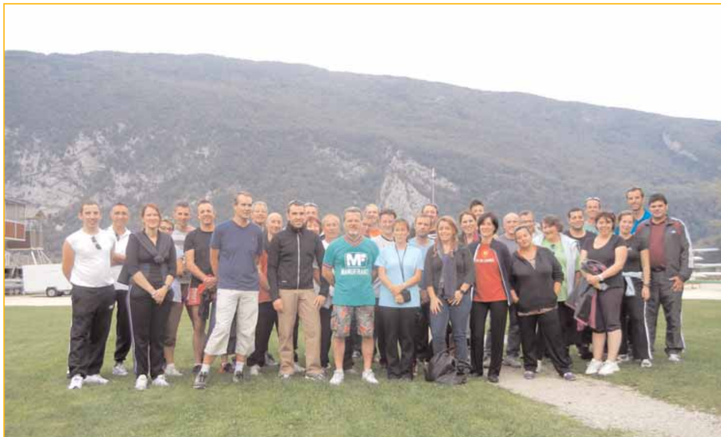
Le Groupe SNCF de Saint-Etienne lors de la journée de cohésion d'équipe