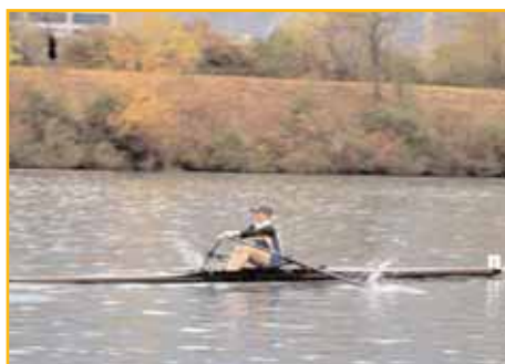
Évangéline en skiff